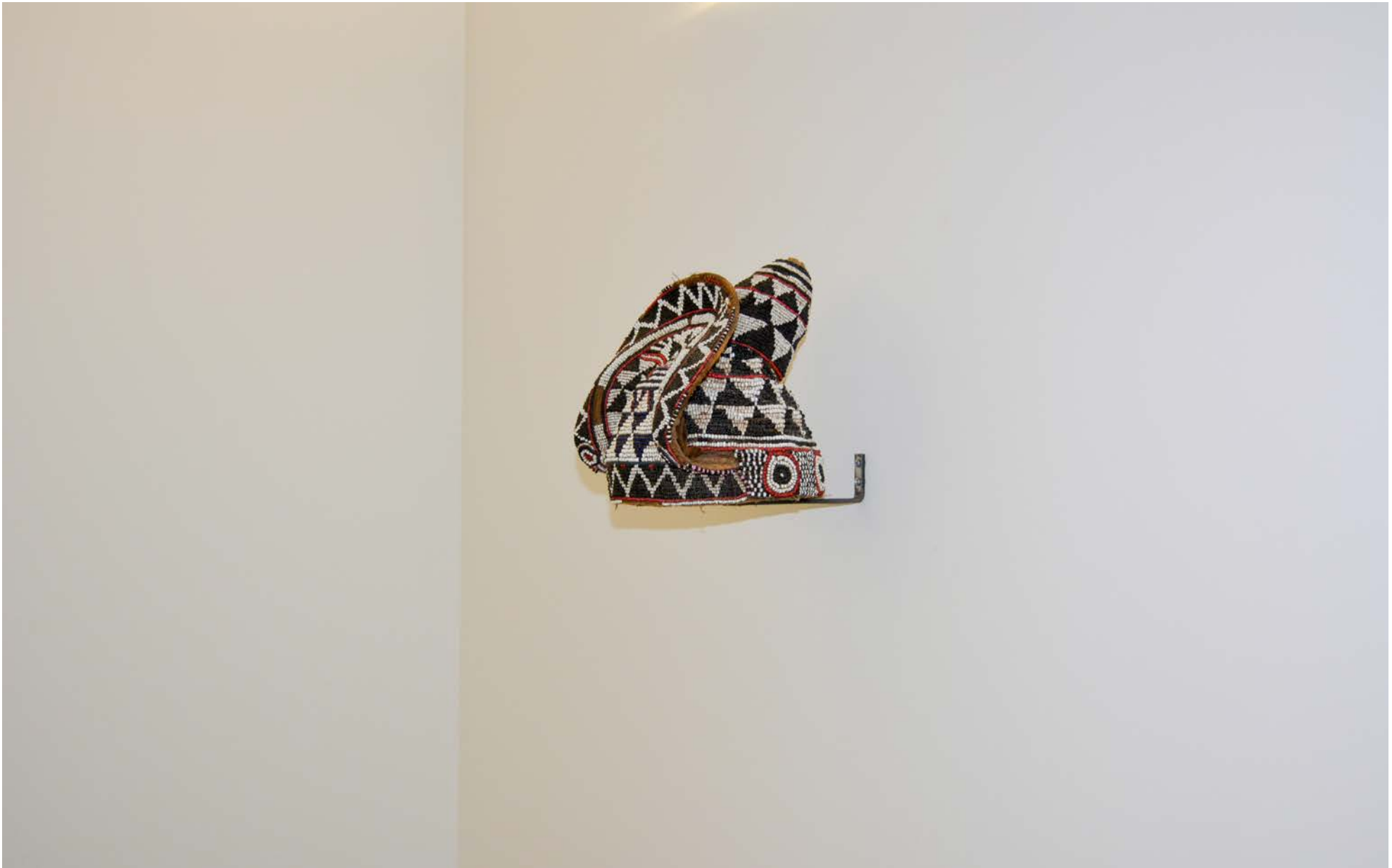
Adorno de cabeça de chefe tribal angolano, cronologia desconhecida 28 x 20 x 18 cm, Col. Museu Militar de Bragança, Inv. MMB00757