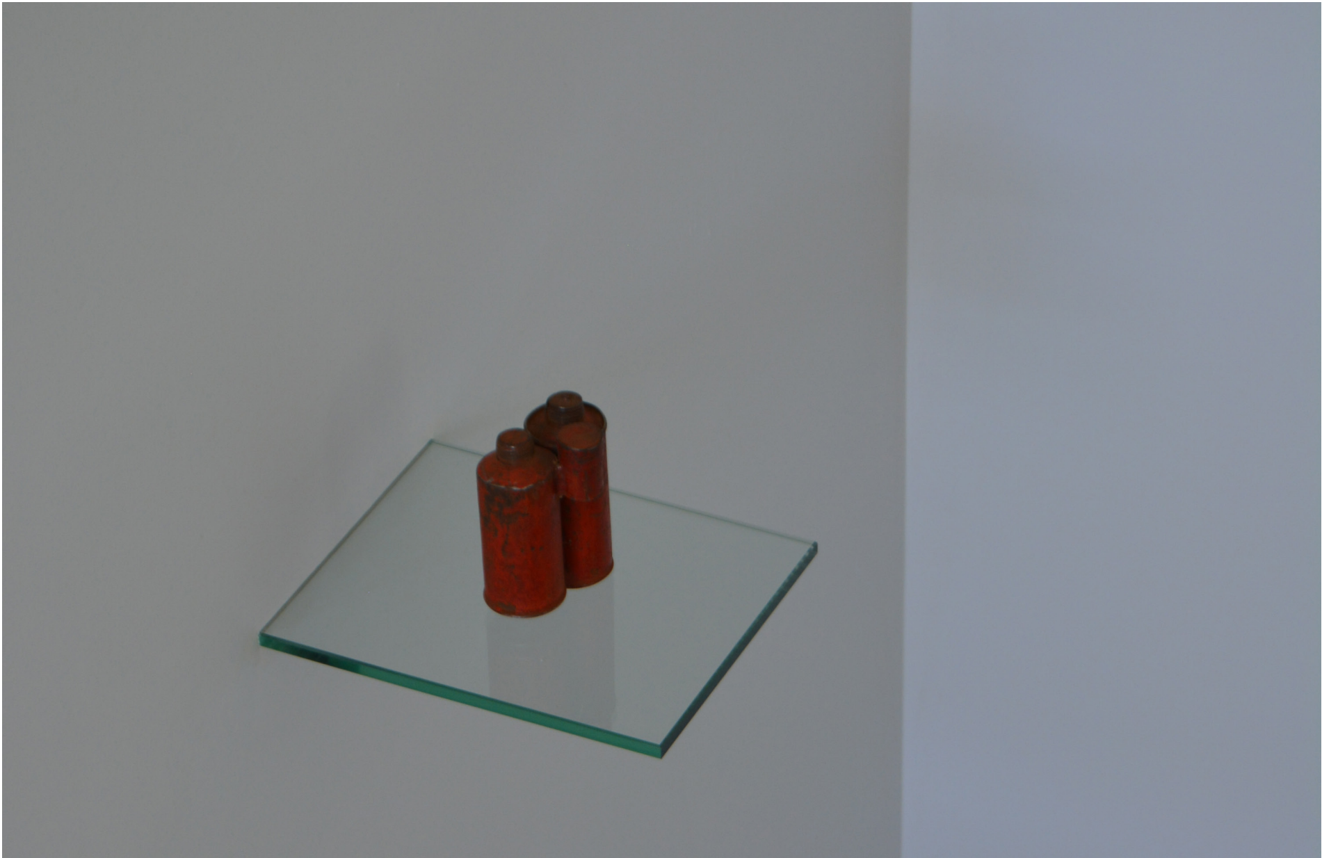
Caixa de Chumbos, início do Séc. XX 11 x 8 x 6 cm, Col. Museu do Abade de Baçal, Inv. MAB-Etn.02