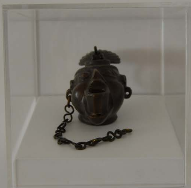
Lucerna, Alto Império Romano (Sécs. I a.C. a III d.C.) 10 x 6 x 5 cm, Col. Museu do Abade de Baçal, Inv. MAB-1387