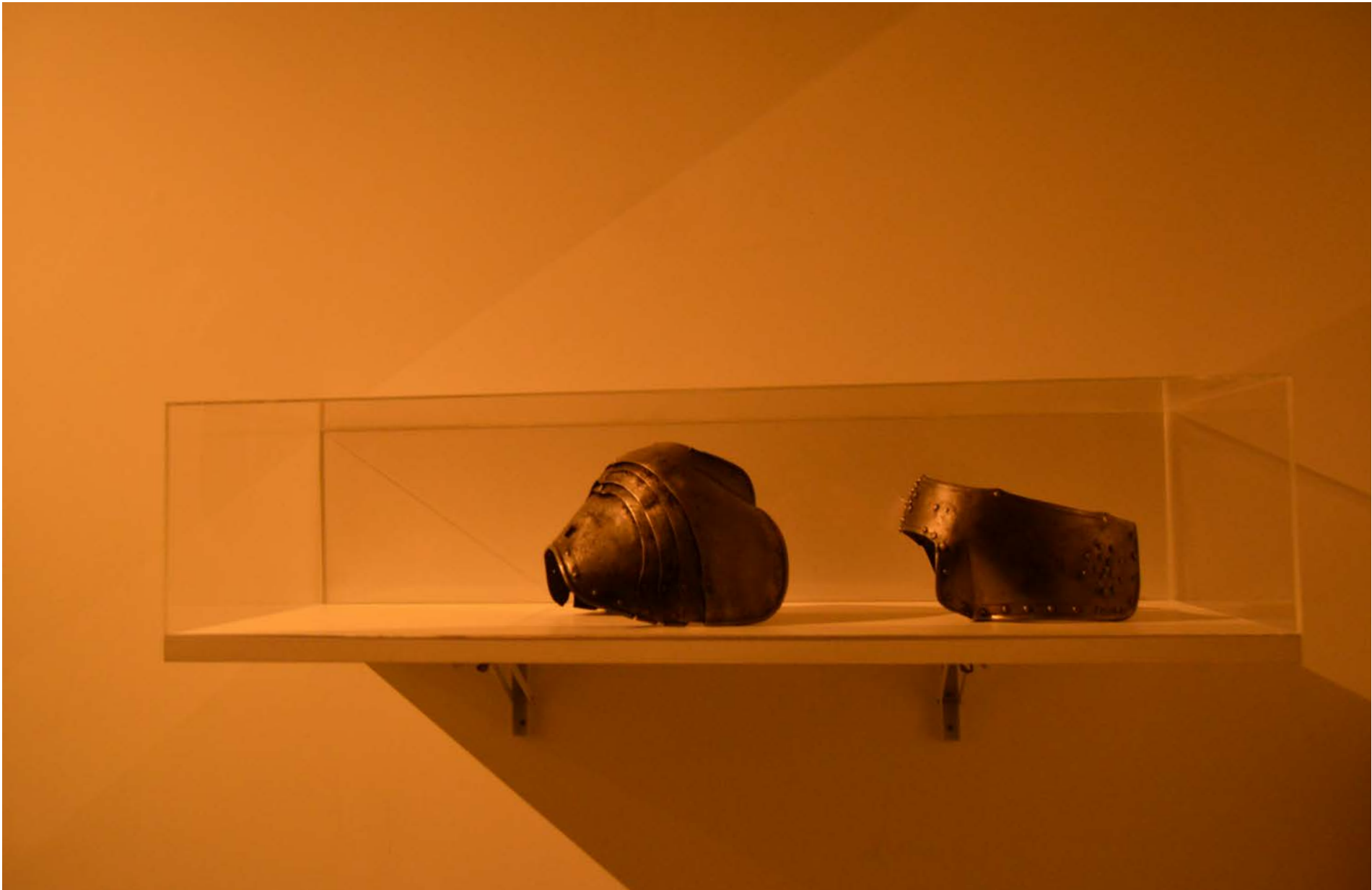
Espaldeira, Séc. XVI 27 x 27 x 20 cm, Col. Museu Militar de Bragança, Inv. MMB00673