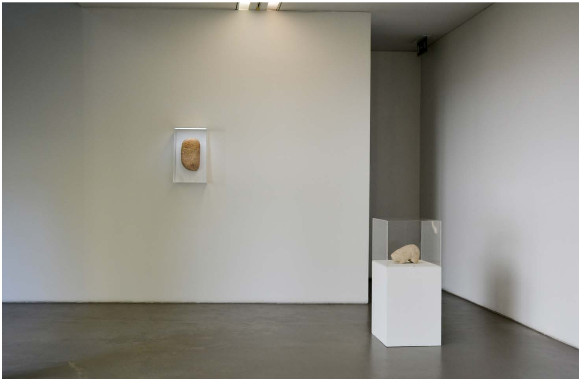
Estela-estátua antropomórfica, Calcolítico (c. 2500 a 1800 a.C.) 33 x 18 x 10 cm, Col. Museu do Abade de Baçal, Inv. MAB-Arq.02