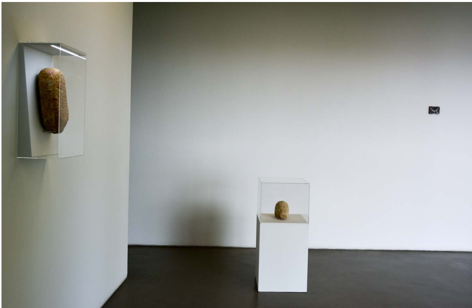
Estela-estátua antropomórfica, Calcolítico (c. 2500 a 1800 a.C.) 33 x 18 x 10 cm, Col. Museu do Abade de Baçal, Inv. MAB-Arq.02