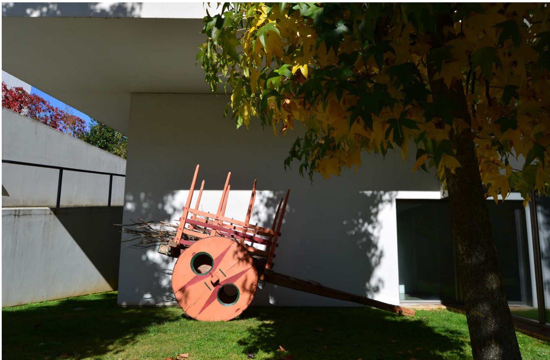
Carro de Bois, Séc. XX 440 x 235 x 188 cm, Col. Hélder Esteves