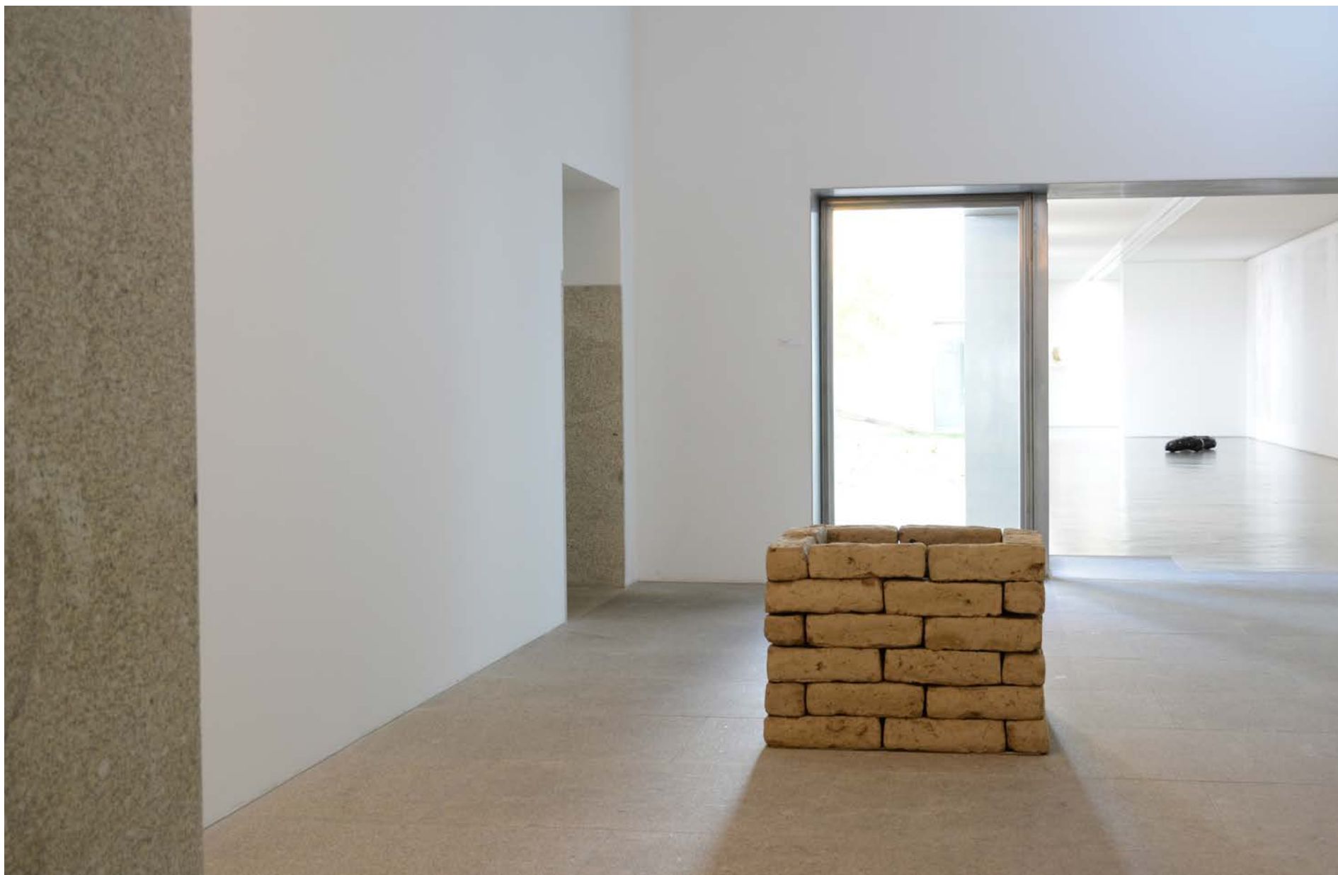
Fornalha, Séc. XX 84 x 60 x 86 cm, Col. Museu Etnográfico Dr. Belarmino Afonso, Inv. 157