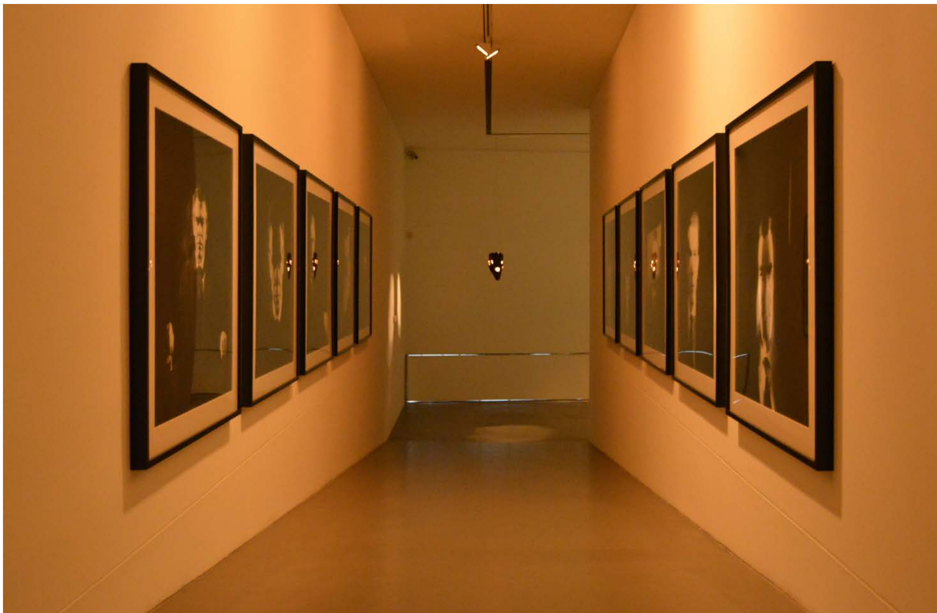
Jorge Molder (1947) Da série Inox , 1995 Prova de Gelatina Sal de Prata, 10 x (110 x 110 cm), Col. da Caixa Geral de Depósitos, Inv. 402763