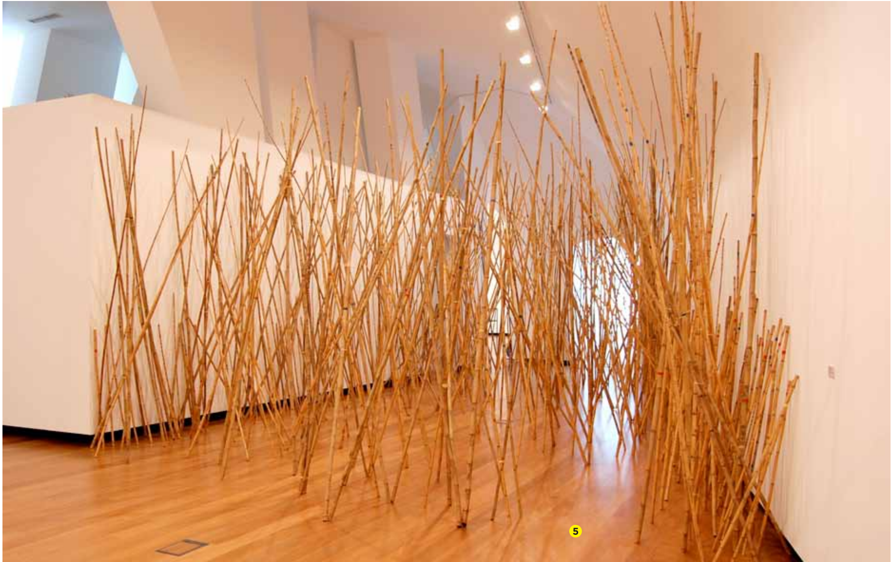
Alberto Carneiro (1937) O canavia: memória metamorfose de um corpo ausente , 1968 Canas, fitas de cor, letra de decalque e rãfia Inventário 360824