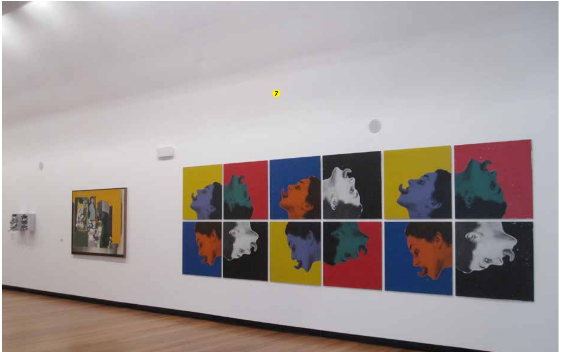
Lourdes Castro (1930) Caixa alumínio (lagostins) , Paris, 1962 Técnica mista Inventário 348001