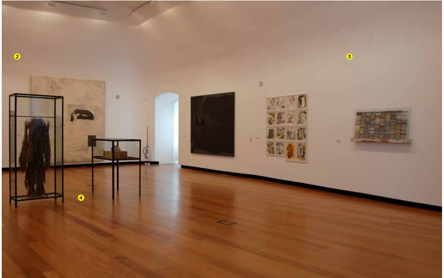
Julião Sarmiento O peso de um gesto , 1990 Acrílico sobre tela Inventário 328883