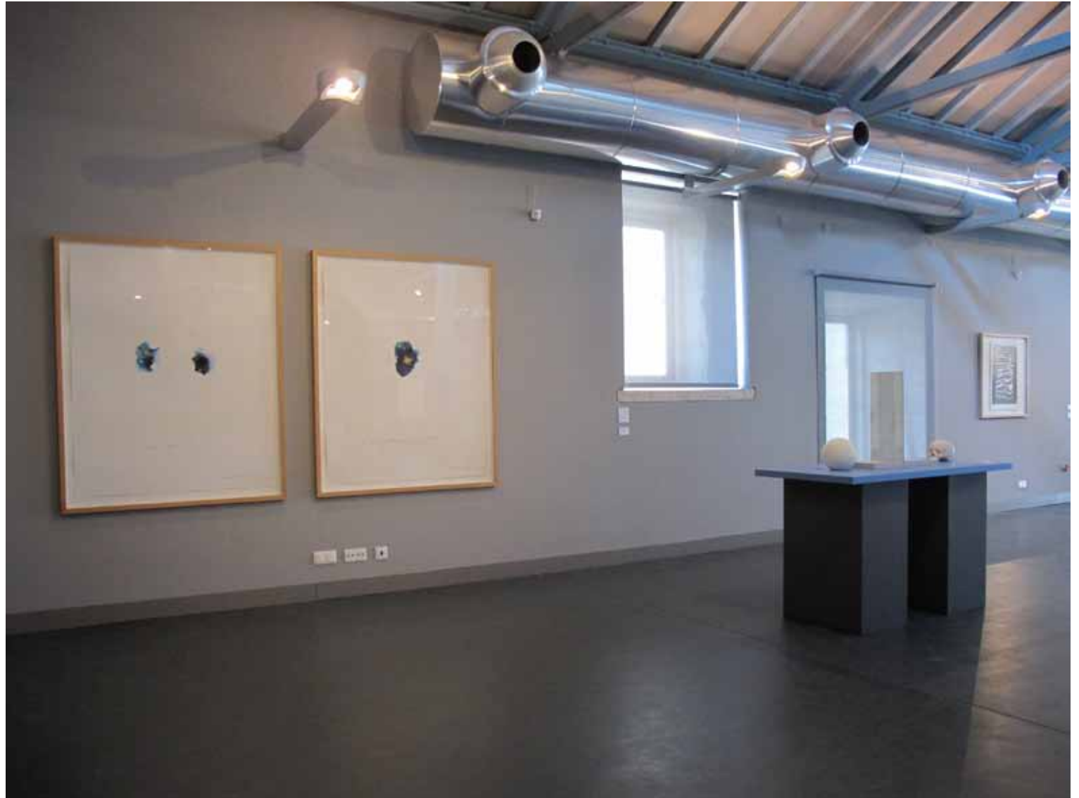
Marta Wengorovius Sem título ( parce que, car ), 1995