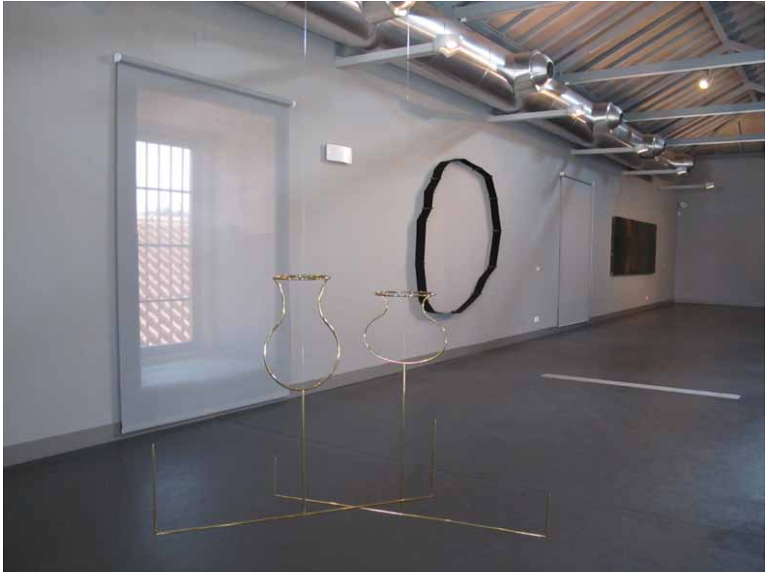
Waltercio Caldas A mesa , 1996