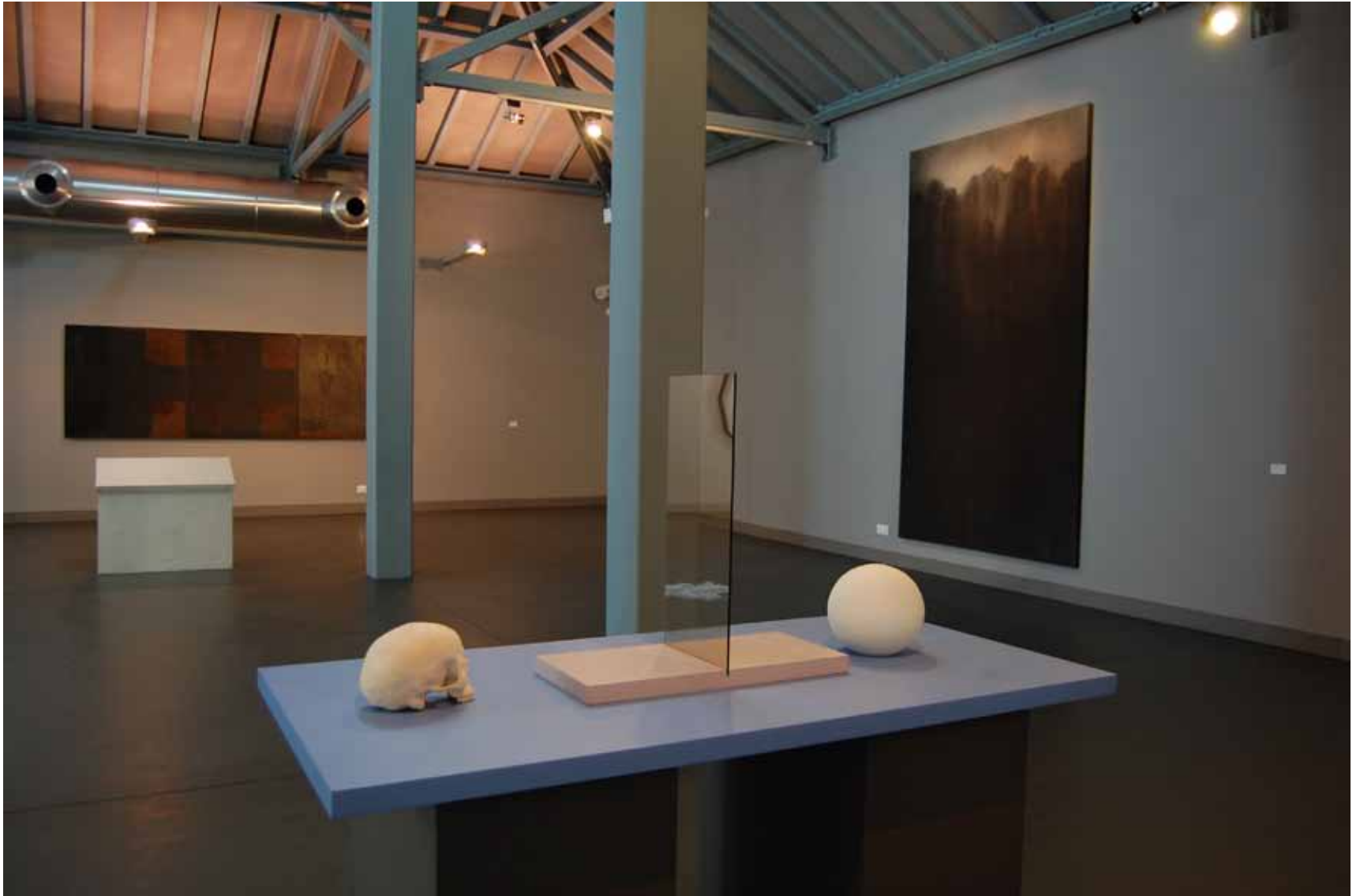
José Pedro Croft Sem título, 1990