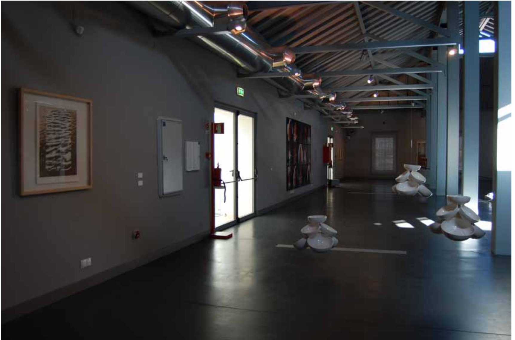
Fernando Calhau Sem título, 1975