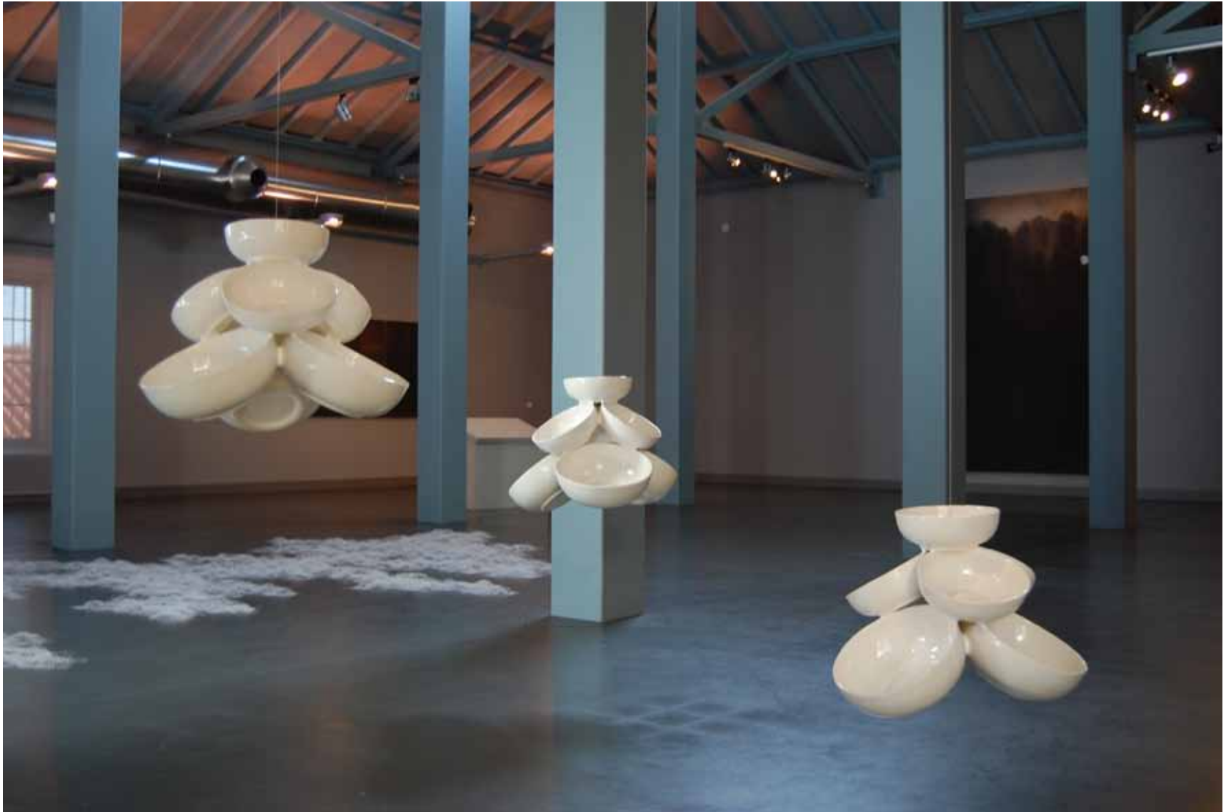
Armanda Duarte Action line , 1999