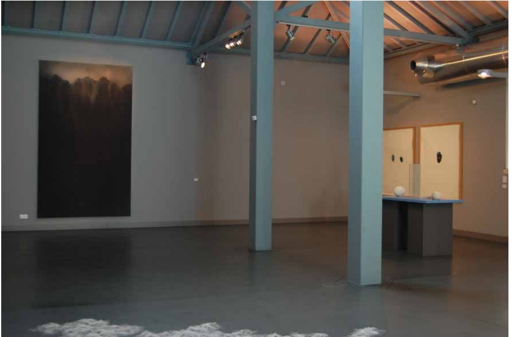
Michael Biberstein Very large attractor , 1991