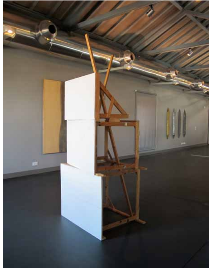
Zulmiro de Carvalho Sem título, 1983