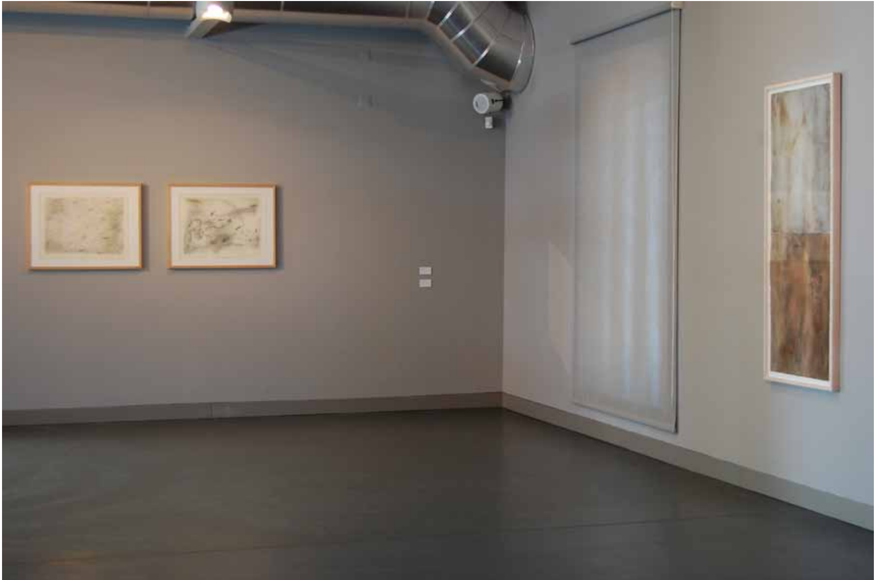
Pedro Cabrita Reis Sem título, 1982