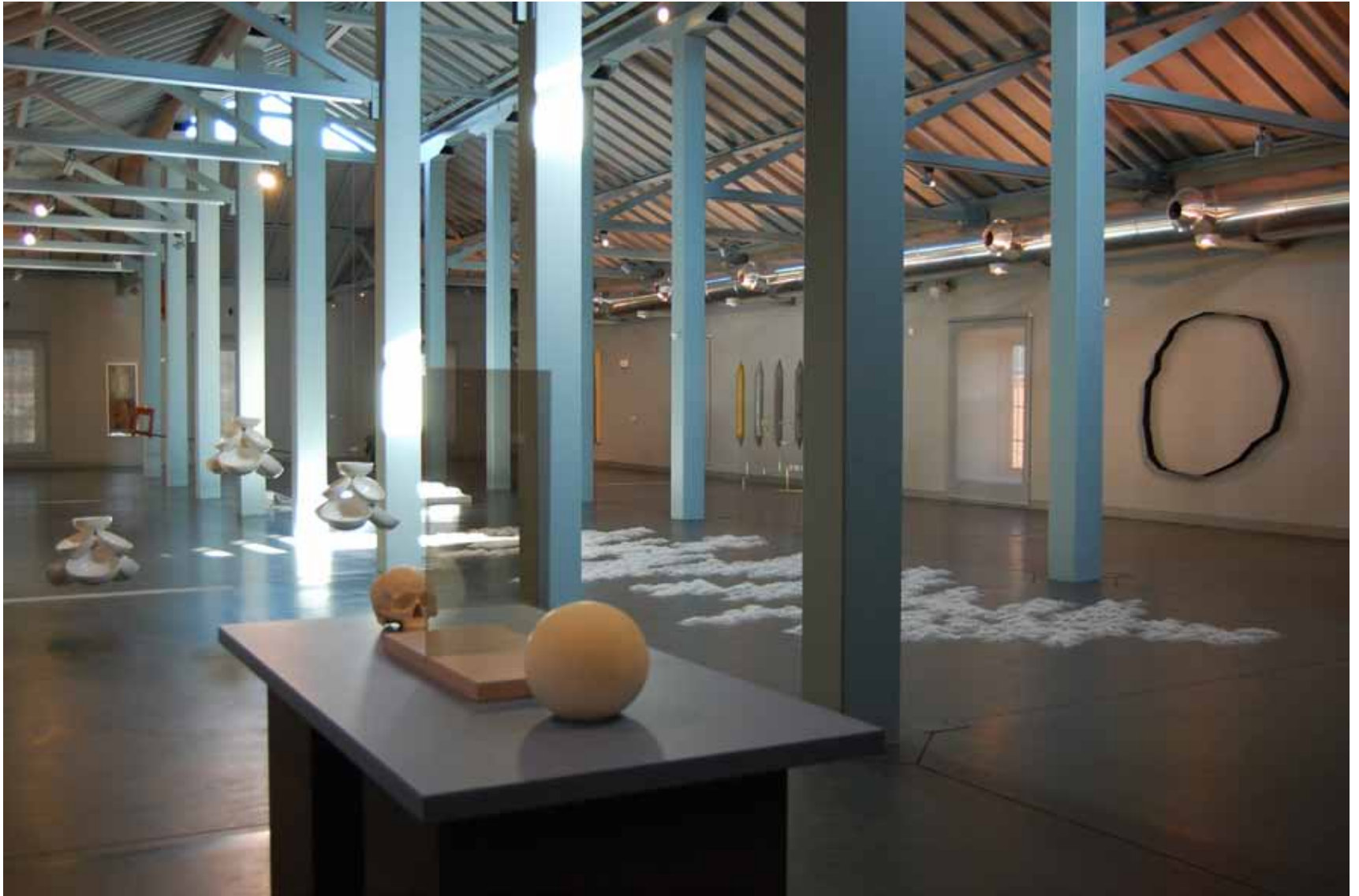
Valeska Soares Les tournants , 2000