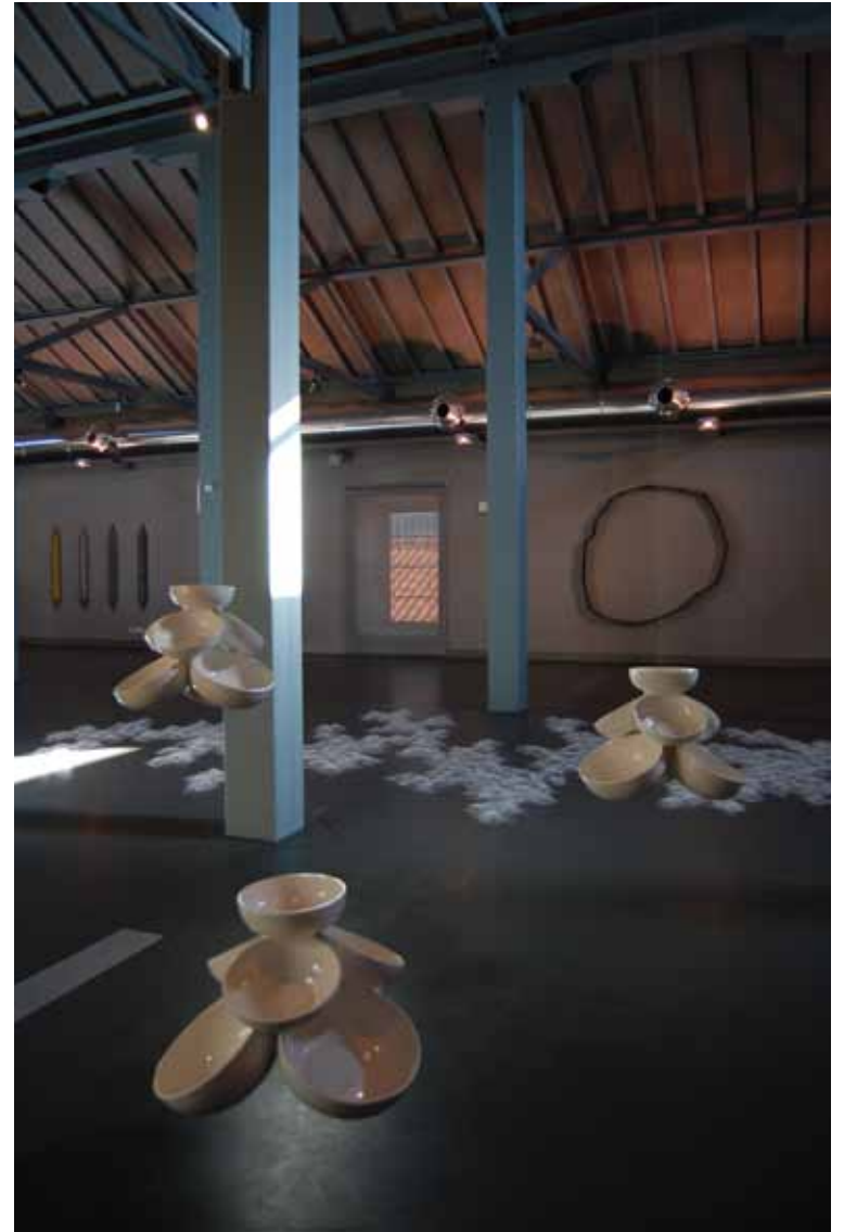
Marcos Coelho Benjamin Sem título, 1999