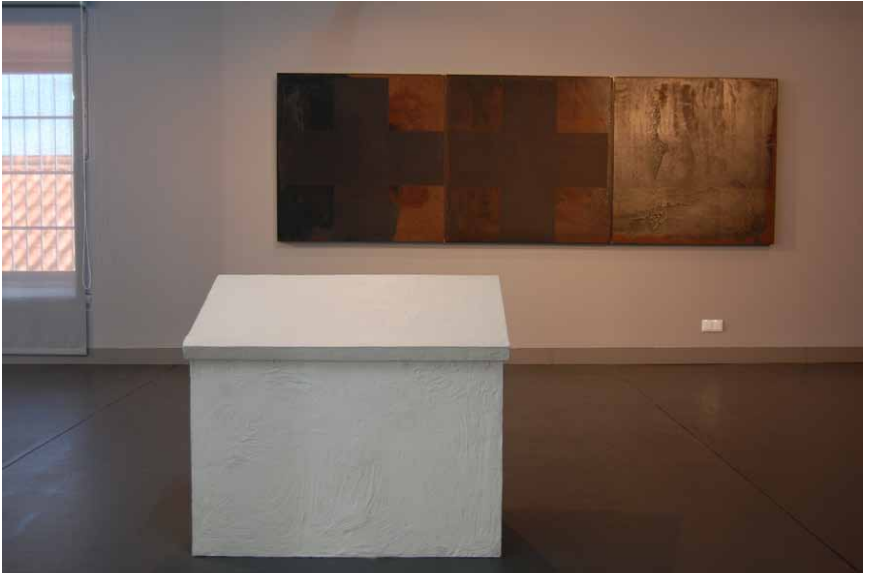
José Pedro Croft Sem título, 1990