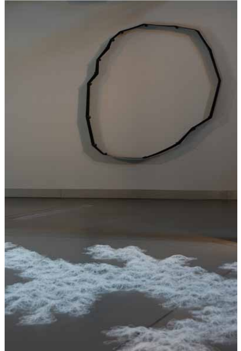
Armanda Duarte Action line, 1999