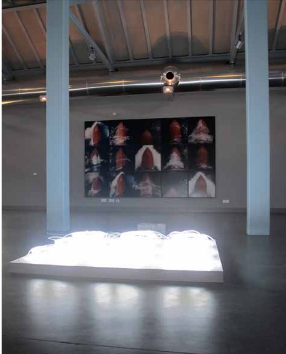
André Cepeda Seqüência #9, 2000