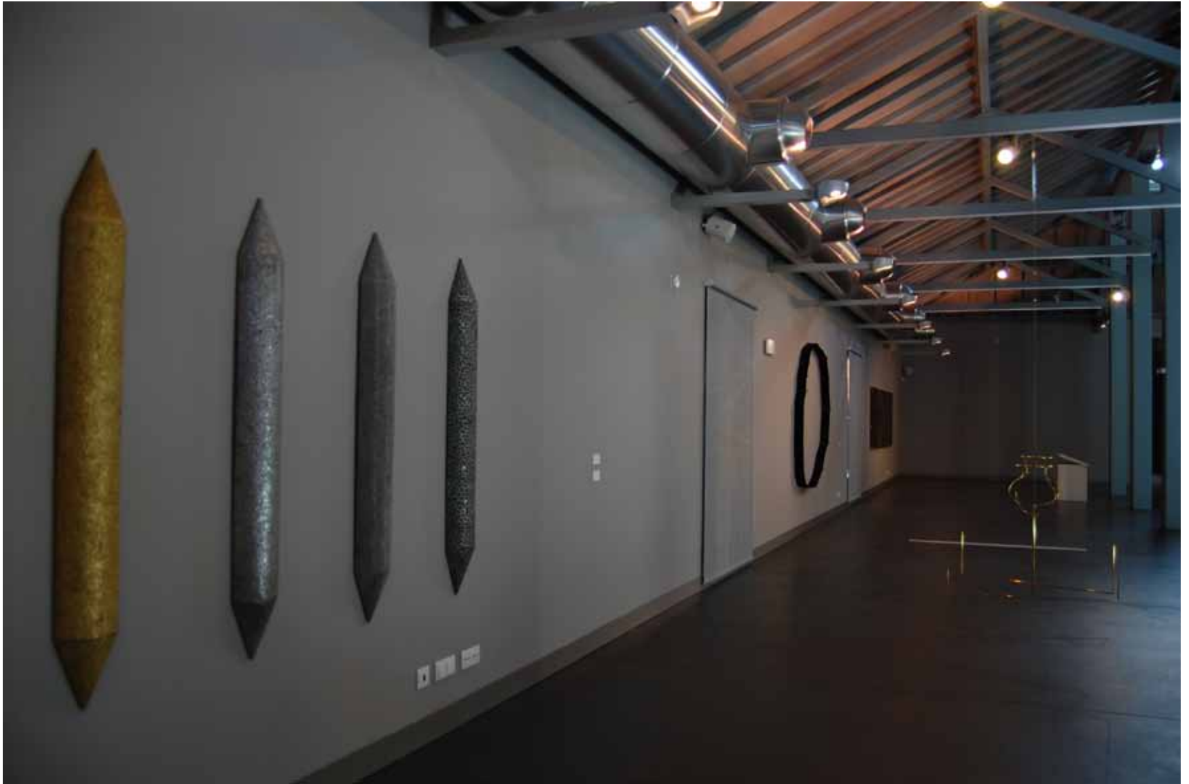
Marcos Coelho Benjamin Sem título, 1999