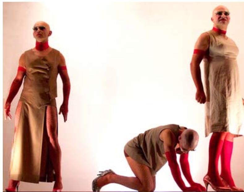
O Homossexual ou a Dificuldade em Expressar-se, 2007