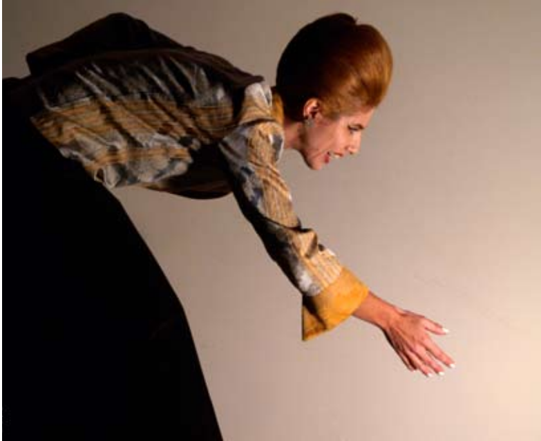
A Dificuldade em se exprimir, 2005 © MC

Nasceu em Nampula, Moçambique, em 1961, licenciou-se em Medicina Veterinária em 1984, completou o curso de Língua e Cultura Italianas em 1990. Da sua formação artística fazem parte ateliês e estágios diversos, a frequência da Escola Superior de Teatro e Cinema, o curso de Teatro da Universidade Técnica, aulas regulares no Actor's Centre, em Londres, e o estudo de Canto Lírico. Trabalha profissionalmente como actor