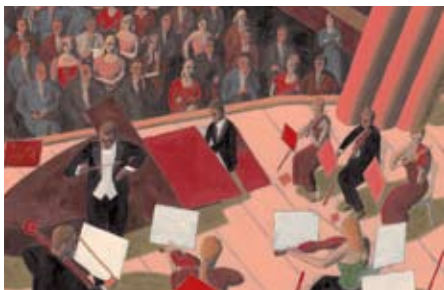
Jeu (Jogo) de George Schwizgebel