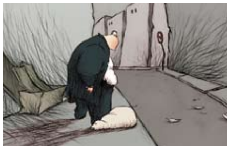
Cândido de José Pedro Cavalheiro

MADAME TUTLI-PUTLI (A Senhora Tutli-Putli) de Chris Lavis/Maciek Szczerbowski Canadá, 0:17:21 PRÉMIO RTP2 – ONDA CURTA, GRANDE PRÉMIO CINANIMA 2007 – PRÉMIO CAIXA GERAL DE DEPÓSITOS (EX-AEQUO), PRÉMIO ALVES COSTA