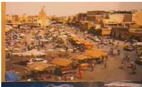
Um mundo melhor de Anilupa