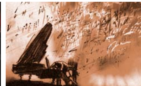
Contos do Velho Piano – Ludwig Van Beethoven de Vladimir Petkevich

de Peter Baynton Reino Unido, 0:07:40 PRÊMIO RTP2 – ONDA CURTA CATEGORIA Curtas-Metragens (até 15 minutos) ANO 2007 FORMATO Betacam SP Pal COR cor TÉCNICAS Computador 2D PRODUÇÃO Margaret Milder Schmuck & Ian Culbard, Reino Unido ARGUMENTO Peter Baynton ANIMAÇÃO Peter Baynton, Wip Vernooij MÚSICA Oliver Davis SOM (EFEITOS DE SOM) Tom Russell Os residentes do Lar Over the Hill vêem o tempo passar de uma forma vagarosa. Até que um trio de “avózinhas” astutas descobre um segredo tão sinistro que faz as suas vidas mudar para sempre.