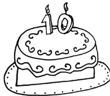
Desenho: Carlos Bártolo

“Não sei exactamente quando perdemos a nossa noção de realidade ou o nosso interesse nela, mas a certa altura foi decidido que a realidade não era a única opção. Era possível, permissível e até desejável aperfeiçoá-la; podia-se substituir por algo mais agradável. A arquitectura e o meio ambiente como um embrulho ou uma representação, como um desprendimento da realidade, é uma noção que, infelizmente, parece ter chegado. Considerando ou não a demolição e os desastres naturais, a arquitectura é a arte mais imediata, expressiva e durável que alguma vez registou a condição humana. As cidades são os recipientes e os geradores da nossa história e cultura. Nós somos aquilo que construímos; a pedra e o aço não mentem. Mas tem havido uma mudança radical no modo como percebemos e compreendemos esta realidade física.”