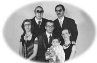
Fotografia: Abel Dias Design: Carlos Bártolo

19 A 27 JANEIRO · FOYER DO GRANDE AUDITÓRIO