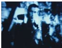
Gary Cooper, Morocco de J. v. Sternberg - 1930

É tudo quanto ao processo, mas o que se pode ver realmente no filme que vai ser projectado? A que deve prestar-se atenção quando se vê uma coisa destas pela primeira vez? Uma das coisas que vai surpreendê-los é a preponderância do rosto humano, sobretudo o plano aproximado e a forma como este é estruturante para cada um dos filmes.