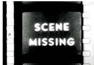
Standard Gauge de Morgan Fisher

Apesar do filme ser um plano contínuo, cada segmento de película preenche o enquadramento, inflectindo o plano, criando o efeito de uma sucessão de planos. O filme combina duas convenções tidas como mutuamente exclusivas, ou mesmo antagonistas: a montagem – a construção de um filme