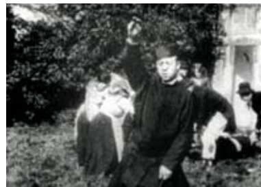
Gloria! de Hollis Frampton