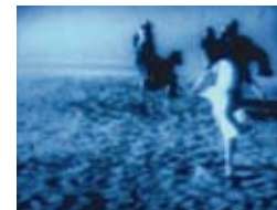
Marlene Dietrich, Morocco de J. v. Sternberg - 1930

Através da justaposição ficamos com a impressão, como espectadores, que o actor se deslocou de um plano para o outro e que no lugar do corte decorreu um determinado tempo. O tempo que o actor necessita para se deslocar de um espaço para outro, em caso extremo até de Viena para Paris. O que é interessante é que desta forma é possível integrar facilmente saltos temporais no decorrer