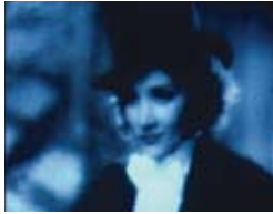
Gary Cooper e Marlene Dietrich, Morocco de J. v. Sternberg - 1930

Este segundo tipo de montagem, caracterizado pelo processo de campo/contra-campo com o todo como moldura, onde se salta entre duas personagens, constitui a coluna vertebral formal no cinema. Contrariamente à montagem linear que cria o espaço, esta forma de montagem utiliza o espaço, dado que através dela se trunca o espaço que já é conhecido do espectador. A partir daqui, ao longo do decorrer da história do cinema, passou a montar-se cada vez mais com enquadramento idêntico, como se vê em Kiss of Death de Hathaway ou Johnny Guitar de Ray. E é justamente um enquadramento idêntico que nos permite ver as versões compactas com facilidade. Na verdade, isto parece sentir-se como subtexto também nas salas de cinema, em visionamentos normais, a uma velocidade mais lenta, onde nos é proporcionada uma forma de ver sonhadora, pois observamos que os filmes que chegam aos nossos cinemas são cunhados por esta forma de montar. Os filmes que apenas contêm poucos cortes de campo/contra-campo têm mais dificuldades.