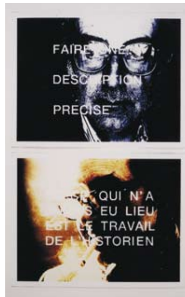
Moments Choisis des histoire(s) du cinéma de Jean-Luc Godard

FREDDY BUACHE: Parece-me que podíamos colocar um ponto final nisso, porque as coisas foram ditas de modo claro. Há, nessa perspectiva precisa, do ponto de vista de Godard, uma concepção quase revolucionária. De facto, podemos fazer um equivalente a essas antologias impossíveis – quer dizer,