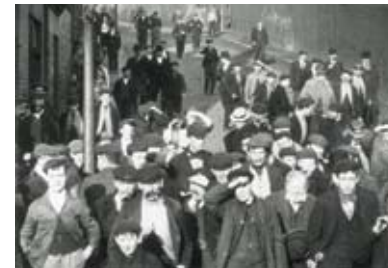
Operários entram na Lord Armstrong's Elswick Works, 1900

Mitchell & Kenyon era uma companhia de cinema sediada em Blackburn no Lancashire, sobretudo conhecida por contribuições menores para o cinema narrativo primitivo e por uma série de filmes de guerra encenados. Esta colecção, no entanto, integra apenas filmes de actualidades encomendados por operadores ambulantes para serem projectados em feiras e noutros locais por todo o Reino Unido. Os filmes dos “portões da fábrica” mostram, nas palavras de Tom Gunning, “um interminável mar de humanidade a rebentar contra a câmara”.