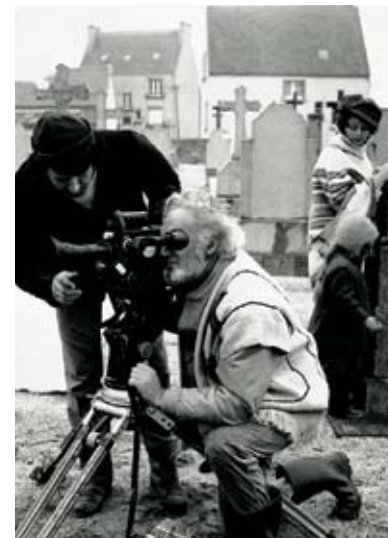
Mourir pour des images de René Vautier

Mourir pelas Imagens reconstitui através de entrevistas a rodagem do filme La mer et les jours . Alain Kaminker desapareceu durante a rodagem do filme. O filme constitui-se como uma interrogação sobre os laços que unem quem filma a quem é filmado.