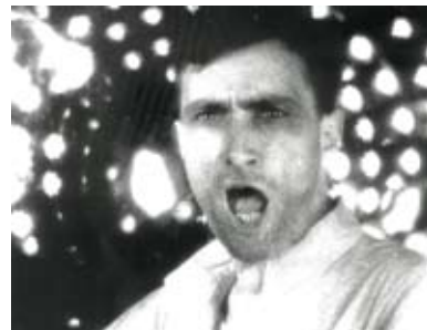
Autour de la Fin du Monde de Eugène Deslaw

Montado a partir da rodagem de La Fin du Monde (1931) de Abel Gance, o filme reúne testes de ecrã de actores, cenas censuradas ou cortadas na montagem e reconstitui o ambiente do estúdio no momento em que se passou do mudo ao sonoro. Destaque para uma imagem rara de Antonin Artaud num teste para um papel não incluído no filme.