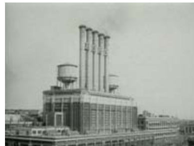
Arbeiter verlassen die Fabrik de Harun Farocki

(...) Ao ver o filme dos irmãos Lumière não nos apercebemos que os operários foram colocados atrás das portas da fábrica e que se puseram a andar ao sinal do operador. Antes que a câmara lhes limitasse o espaço, a ordem industrial sincronizava as vidas destes inúmeros indivíduos. Libertados dessa ordem à hora fixa, saem como se fossem canalizados, enquadrados pelas saídas do edifício. A câmara dos irmãos Lumière não tinha ainda visor e não podia ser assegurada do seu campo visual – as portas da fábrica permitiram imaginar um enquadramento cuja definição não provoca dúvidas.