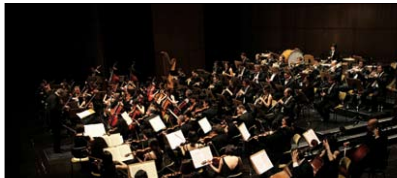
Orquestra Metropolitana de Lisboa