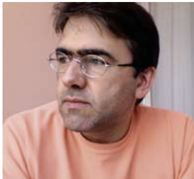
Luís Tinoco (1969) compositor

Luís Tinoco formou-se em Composição na Escola Superior de Música de Lisboa e, posteriormente, com apoio da Fundação Calouste Gulbenkian e do Centro Nacional de Cultura, completou um Mestrado em composição na Royal Academy of Music em Londres.