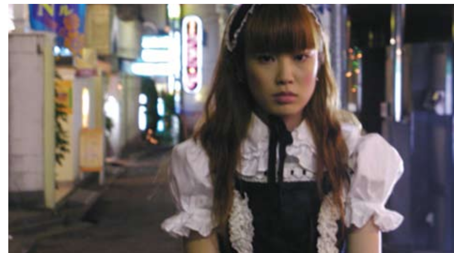
Peep "TV" Show , 2003 - de Yutaka Tsuchiya CINEMA NIPPON KOMA – FESTIVAL DE CINEMA JAPONÊS