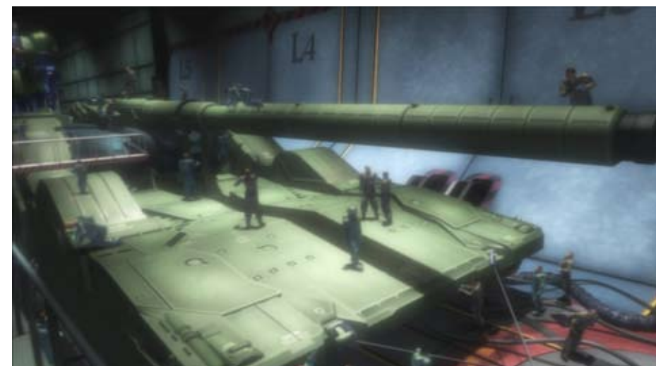
Mobile suit Gundam MS Igloo , 2005 - de Takashi Imanishi CINEMA NIPPON KOMA – FESTIVAL DE CINEMA JAPONÊS