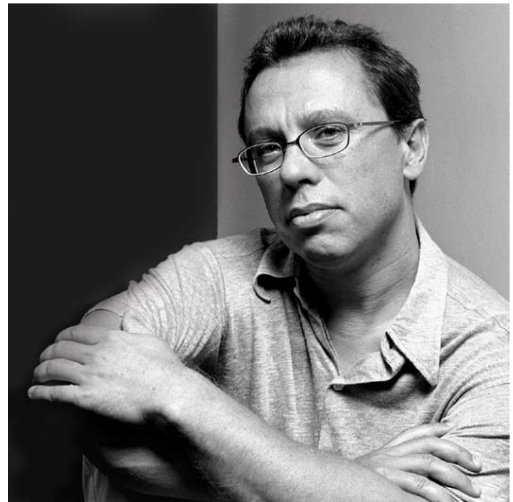
CONCERTO DE JAZZ CANÇÕES E FUGAS · MÁRIO LAGINHA