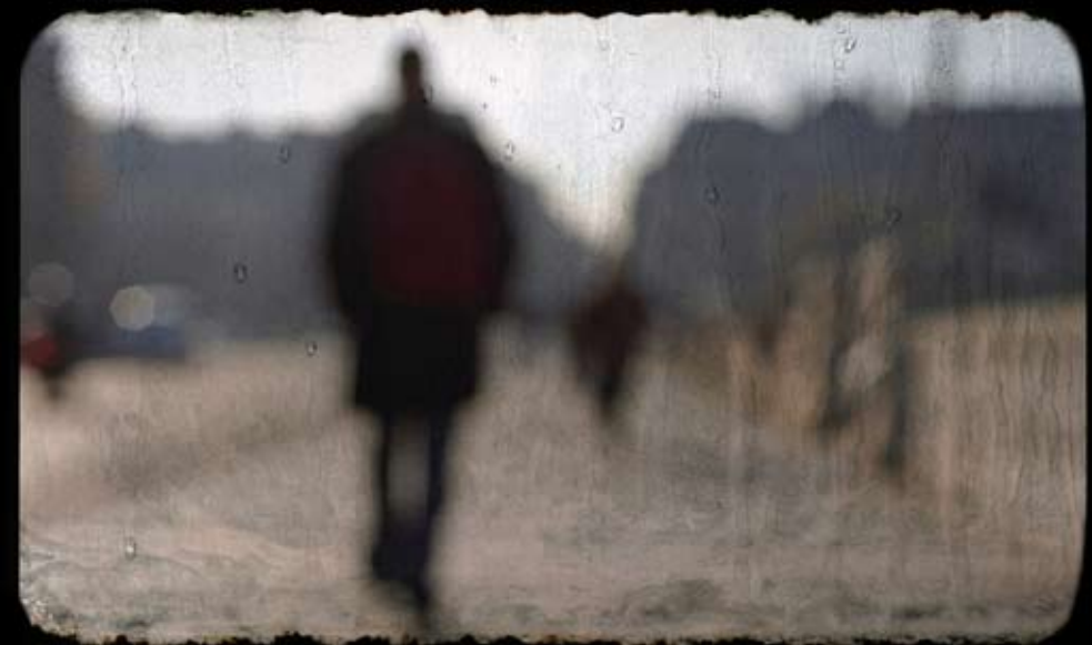
CONCERTO DE JAZZ ASCENT - PELO BERNARDO SASSETTI TRIO 2 © BERNARDO SASSETTI