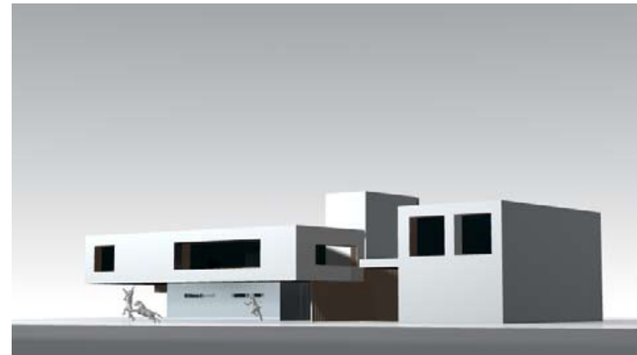
Moment of Love (Momento de Amor) , 2005 - de Teevee Graphics CINEMA NIPPON KOMA – FESTIVAL DE CINEMA JAPONÊS

GA: GRANDE AUDITÓRIO • PA: PEQUENO AUDITÓRIO • FGE: FOYER DA GALERIA DE EXPOSIÇÕES