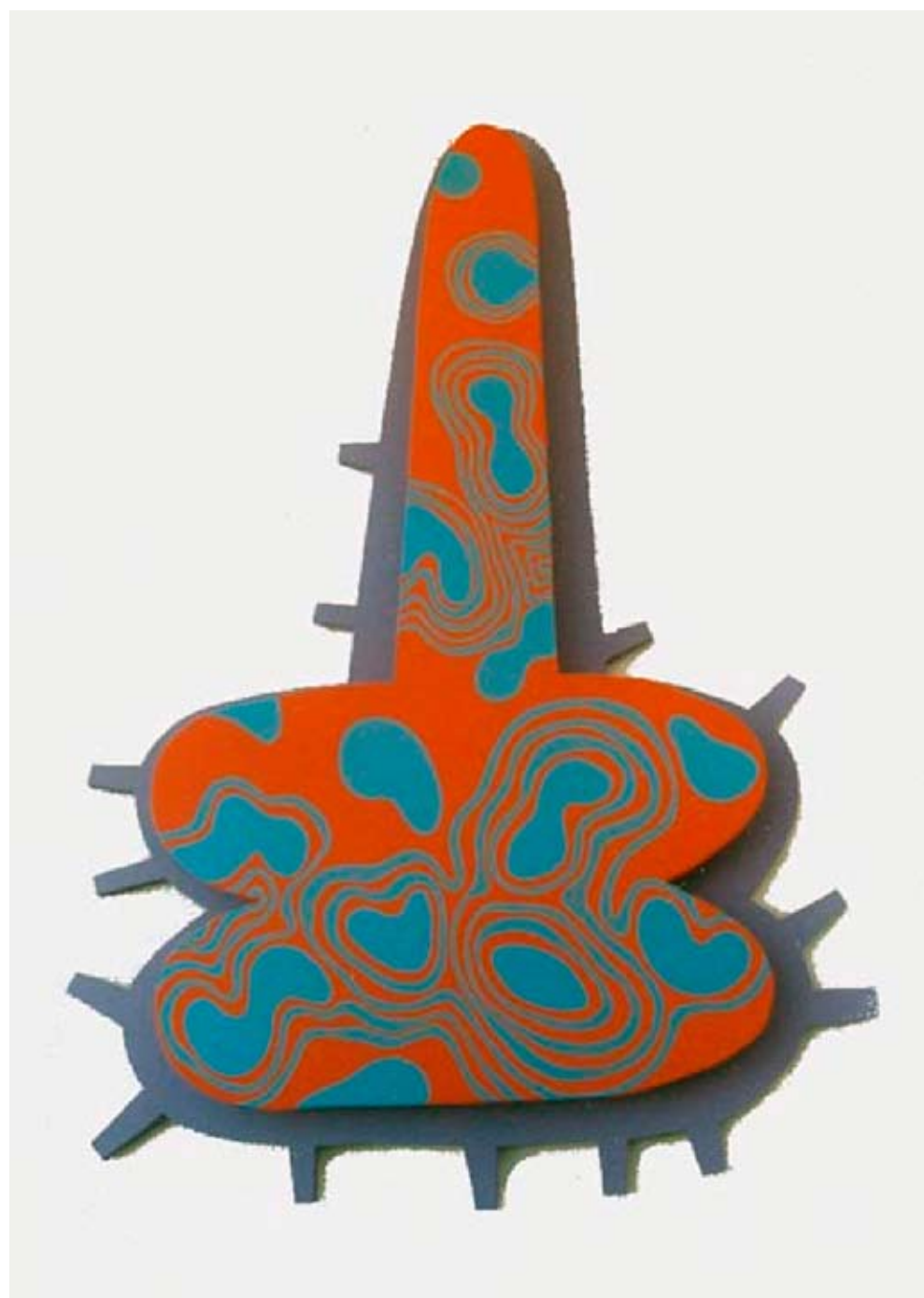
Xana - Sem título , 1997 - Pintura acrílica sobre MDF - 98 x 68 x 6 cm. - Col. Particular, Lisboa © O artista EXPOSIÇÃO XANA. ARTE OPACA E OUTROS FANTASMAS