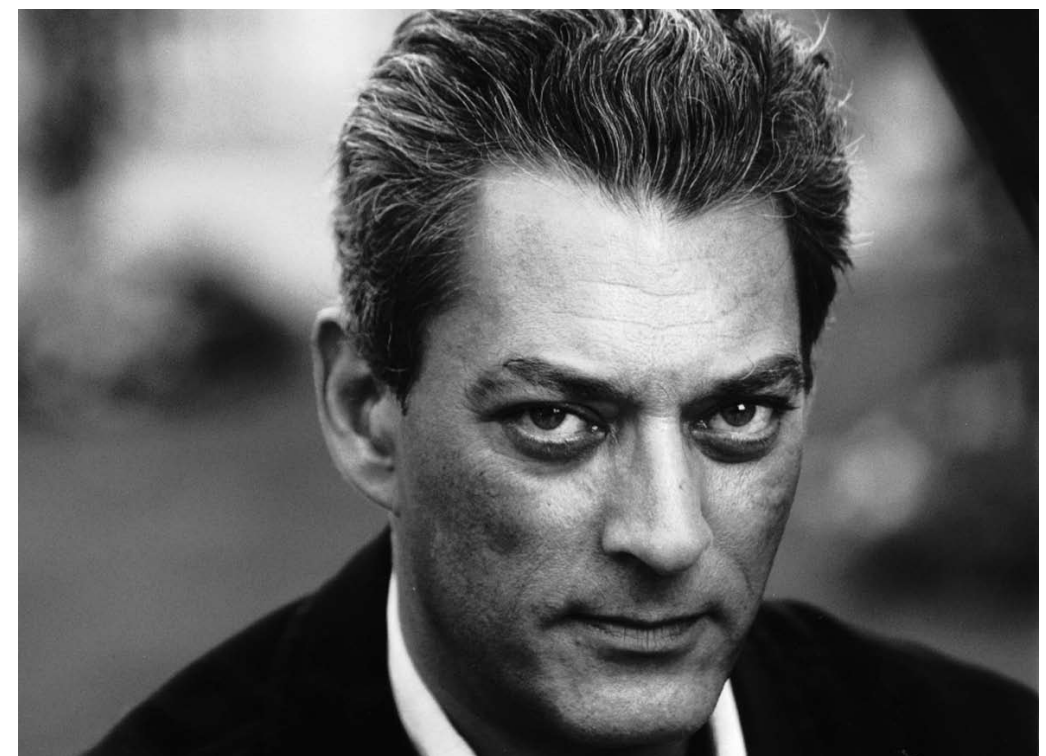
CONVERSAS À CONVERSA COM PAUL AUSTER