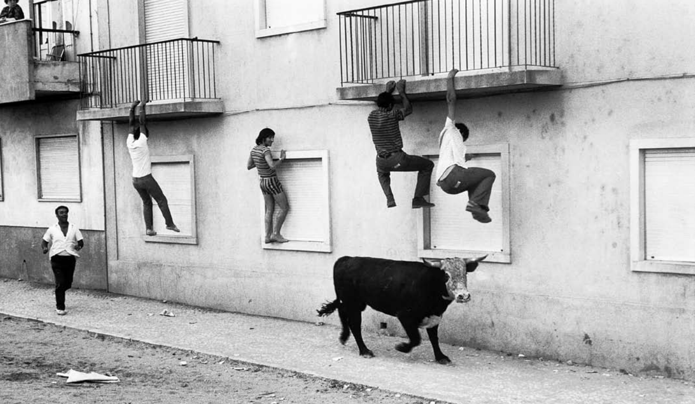
CINEMA DOCLISBOA 2005 – III FESTIVAL INTERNACIONAL DE CINEMA DOCUMENTAL