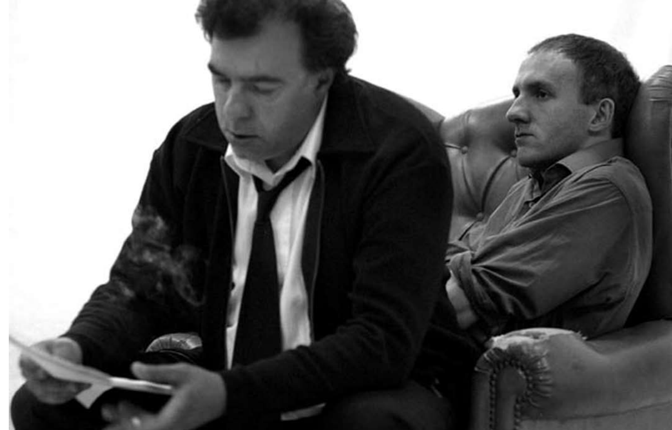
TEATRO UM NÚMERO - DE CARYL CHURCHILL - UM ESPECTÁCULO DA ASSÉDIO

GA: GRANDE AUDITÓRIO • PA: PEQUENO AUDITÓRIO • F: FOYER • S: SALAS