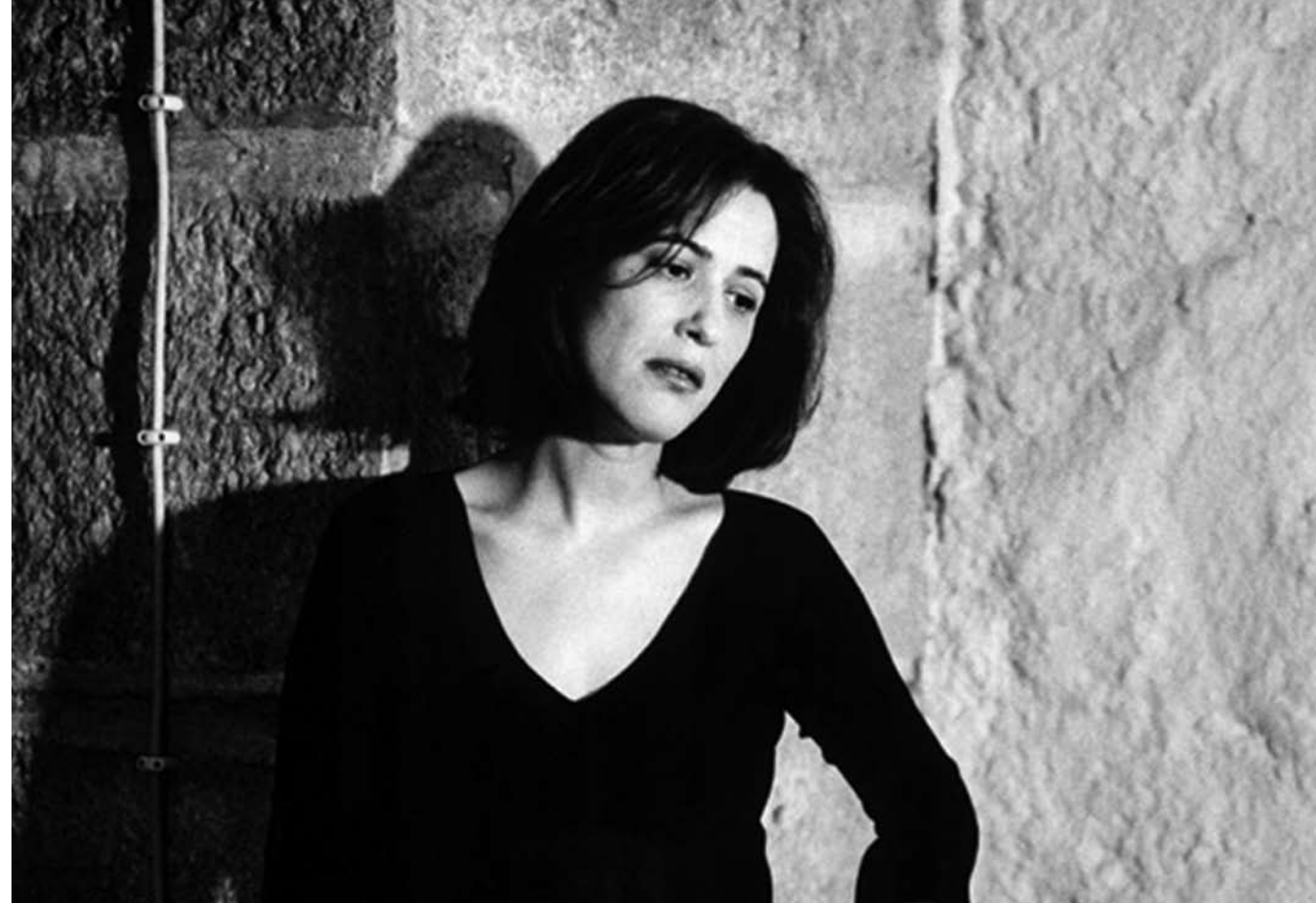
FADO APENAS O AMOR - POR ALDINA DUARTE