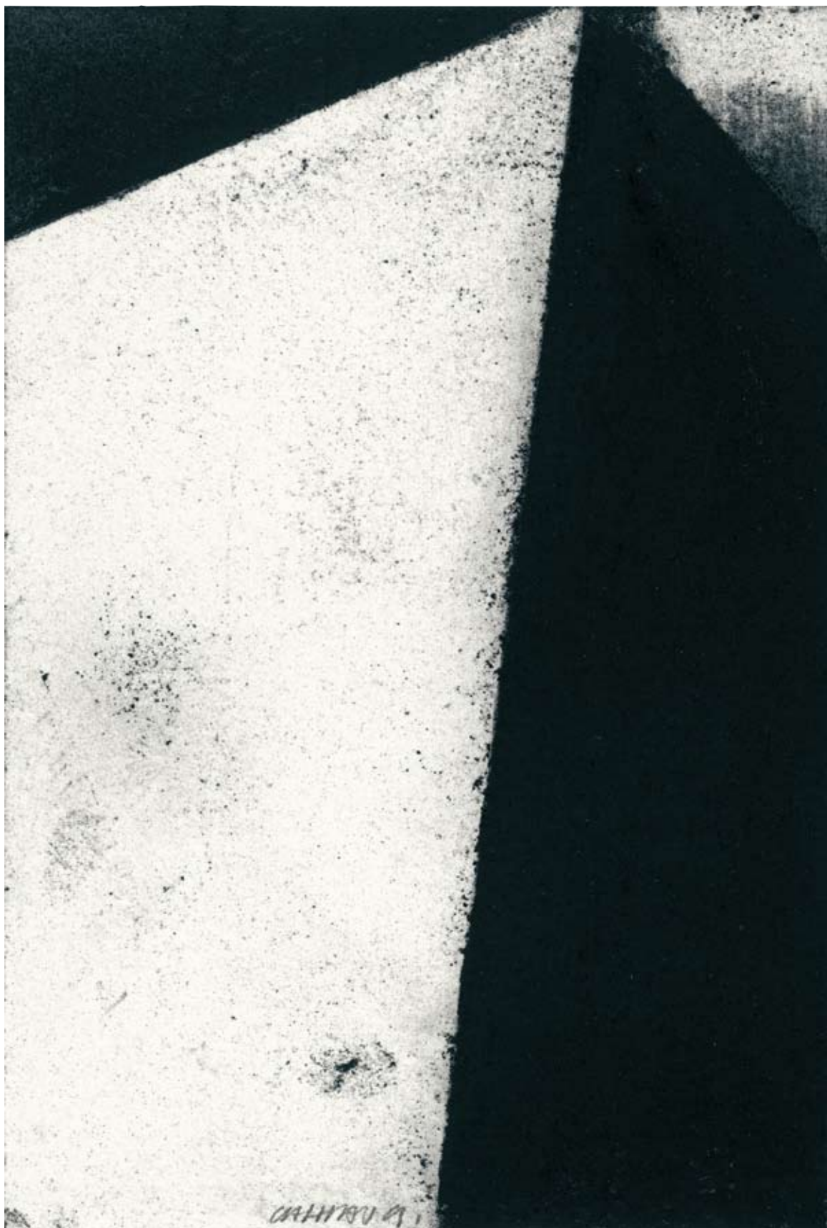
Fernando Calhau - Sem título , 1991 EXPOSIÇÃO ENTRE LINHAS. DESENHO NA COLECÇÃO DA FUNDAÇÃO LUSO-AMERICANA