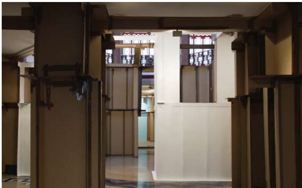
Carlos Bunga · Projecto Culturgest, 2005 · Vista parcial da instalação · Cartão prensado, fita adesiva e tinta plástica EXPOSIÇÃO CARLOS BUNGA