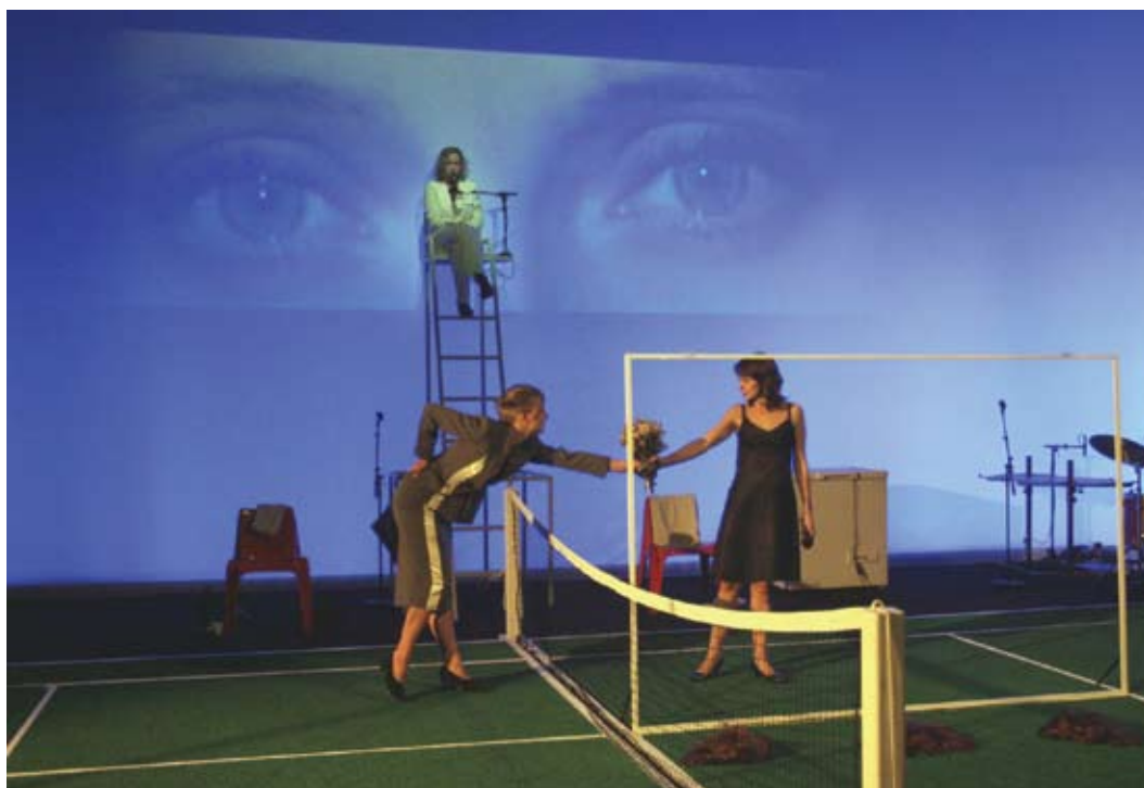
TEATRO L'EXERCICE A ÉTÉ PROFITABLE, MONSIEUR (O EXERCÍCIO FOI PROVEITOSO, CARO SENHOR) UM ESPECTÁCULO DE SENTIMENTAL BOURREAU A PARTIR DE TEXTOS DE SERGE DANÉY