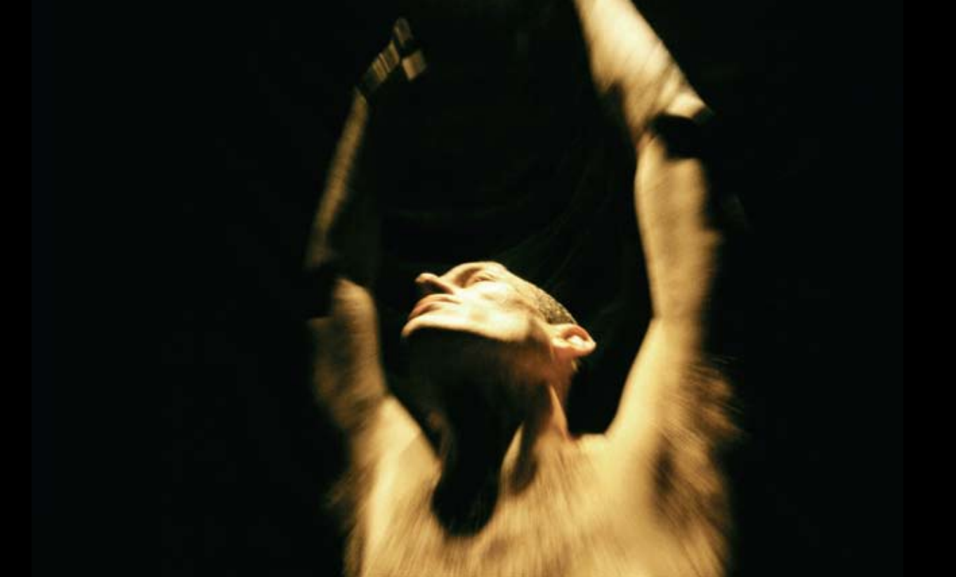
DANÇA SONG AND DANCE (CANÇÃO E DANÇA) · DE MARK TOMPKINS © ANTOINE GIRARD