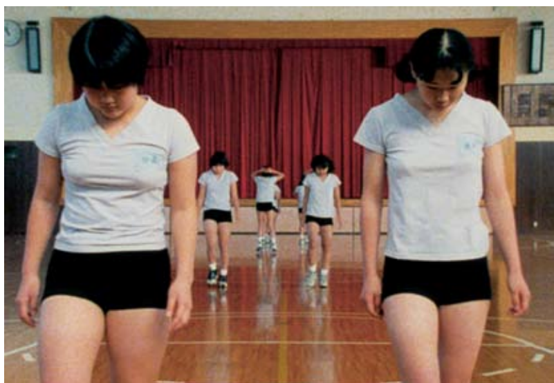
Imagem do filme Goshogoaka - de Sharon Lockart, 1997 CINEMA FIGURAS DA DANÇA NO CINEMA