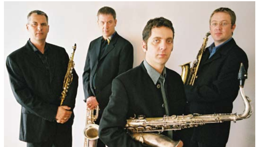
MÚSICA APOLLO SAXOPHONE QUARTET

OLIVEIRA REGO & ASSOCIADOS SOCIEDADE DE REVISORES OFICIAIS DE CONTAS Representada pelo sócio Manuel de Oliveira Rego