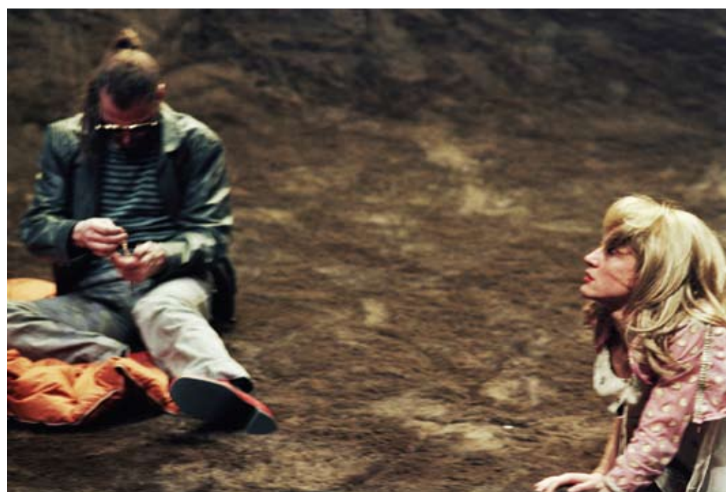
DANÇA FORGERIES, LOVE AND OTHER MATTERS (FALSIFICAÇÕES, AMOR E OUTROS ASSUNTOS) - DE MEG STUART E BENOÎT LACHAMBRE