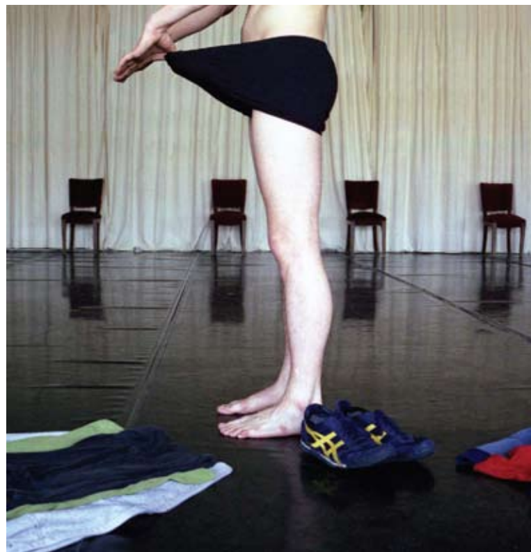
DANÇA CORPO DE BAILE · DE MIGUEL PEREIRA