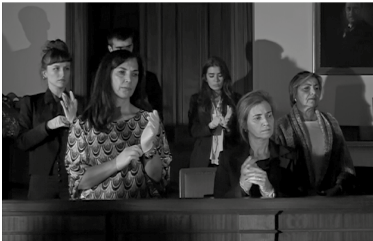
Stíll do vídeo SØMA

Construtor sonoro e cénico que trabalha com pré-linguagem, dub, cristalização, percussão, allopoiesis , animismo e eco. Entre 2016/2018 apresentou a instalação/performance Vocoder & Camouflage no CAC Passerelle/DaňsFabrik (Brest); a peça O Poço no Festival DDD – Teatro Municipal do Porto Rivoli; a instalação Oxidation Machine no DoDisturb Palais de Tokyo (Paris) e na Casa de Serralves; a peça Plethora nos festivais Out.Fest e Verão Azul; e as exposições Afasia Tática na Culturgest e Anóxia na Anozero Bienal de Coimbra. Fundador da plataforma de arte SOOPA. Cofundador da editora discográfica Silorumor. Dirigiu a peça Jungle Machine, Khòros Anima, Sancta Viscera Tua, Del, Silvo Umbra e co-criou as peças Nyarlathotep e Rei Trilogy . Co-organizou o programa Sonores para a CEC Guimarães 2012. Dirige o ensemble HHY & The Macumbas e é cofundador da banda Fujako. Tocou com diferentes formações ou a solo nos festivais Sónar, Primavera Sound, Amplifest, Milhões de Festa, Neopop, Elevate. A sua música está editada na Ångström, Tzadik, Rotorelief, SiloRumor e Wordsound. Tem o filme/ensaio Mundo de Cristal editado pelo Museu de Serralves.